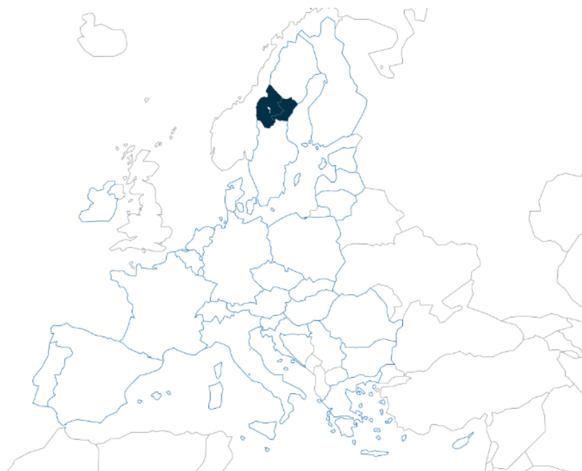
Figur 1. Mellersta Norrlands placering i EU

NUTS2-området Mellersta Norrland består av Jämtlands och Västernorrlands län. Mellersta Norrland omfattar 15 kommuner som tillsammans utgör 17 procent av Sveriges totala landyta, vilket motsvarar mindre europeiska länder såsom Irland eller Litauen. Samtidigt är befolkningstätheten betydligt lägre än i riket som helhet. Programområdet har cirka 373 000 invånare, vilket motsvarar 5,3 invånare per kvadratkilometer. Om Mellersta Norrland hade haft samma befolkningstäthet som Belgien hade invånarantalet varit motsvarande cirka 25 miljoner.