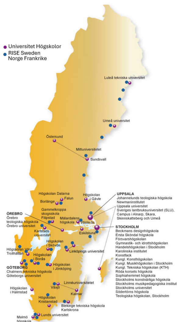
Figur 3 Karta över högskolor, universitet samt forskningsinstitut

Utmaningarna handlar inte enbart om näringslivets struktur, utan också om hur innovationssystemen fungerar i praktiken, hur intermediärer samverkar, hur kunskap sprids geografiskt och hur näringslivets behov fångas upp i strategiska processer.